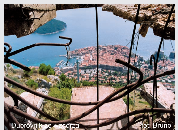
Dubrovnik ze wzgórza