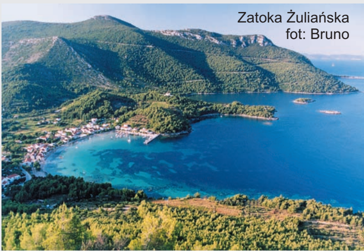
Zatoka Žuliańska