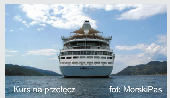
Kurs na przełęcz