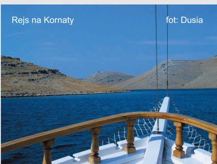
Rejs na Kornaty