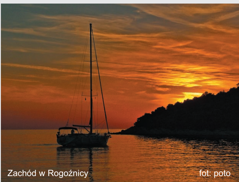
Zachód w Rogoźnicy